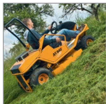
Fino ad una pendenza di 15° per la guida trasversale

Una regolazione laterale particolarmente semplice del piantone dello sterzo è d'aiuto nelle forti pendenze anche lungo le recinzioni e le pareti domestiche per guidare facilmente la tosaerba.