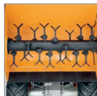
Gruppo falciante inseribile con coltelli singoli snodati.