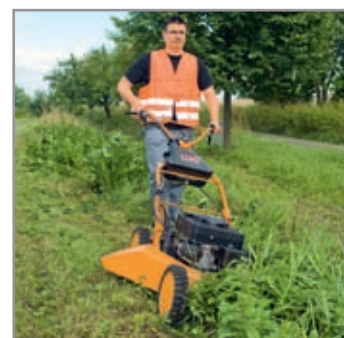
Trazione integrale, il grande aiuto per scarpate e dossi.