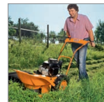
Il rastrellamento è eliminato: deposito dell'erba falciata in un'andana durante la falciatura.

Un'alternativa economica che richiede pochissima manutenzione rispetto alle motofalciatrici a barra. La rotofalce è un'invenzione particolare per coloro che utilizzano l'erba non sminuzzata per la produzione di mangime. L'erba viene depositata lateralmente in un'andana. Non richiede il rastrellamento, soltanto il caricamento in fila.