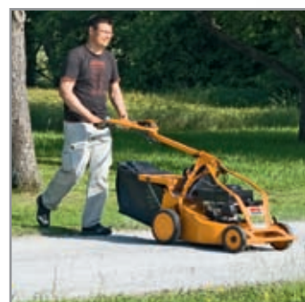
Arresto lama antipietrisco

Carter coprilama parasassi e struttura particolarmente stabile. La potenza di un motore a 2 o 4 tempi AS, la regolazione continua della velocità, le ruote di grandi dimensioni per una trazione ottimale e la tecnologia che richiede pochissima manutenzione consentono all'utilizzatore di avere sempre il meglio. A richiesta con arresto lama.