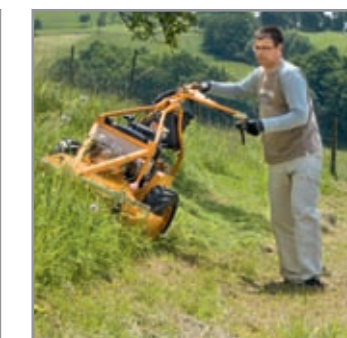
90° di rotazione a sinistra e a destra