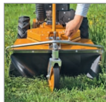
Semplice regolazione dell'altezza