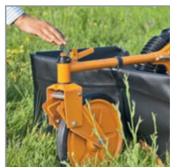
Semplice arresto della ruota anteriore per la guida in rettilineo, trasversale rispetto alla pendenza

Per tutti i lavori di tosatura in grandi prati con erba alta. Con un robusto gruppo di taglio e per il mulching. Grazie ai filtri sulle prese d'aria queste tosaerba Allmäher® possono lavorare anche laddove ad altri modelli manca l'aria a causa dell'erba alta. I pneumatici sono dotati di camera d'aria e hanno un battistrada per uso agricolo. Offrono un'ammortizzazione confortevole contro le vibrazioni, cambio a due marce, freno sulla ruota posteriore e una ruota anteriore sterzabile per un'eccellente manovrabilità.